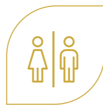
ТУАЛЕТНЫЕ КОМНАТЫ НА 1 ЭТАЖАХ